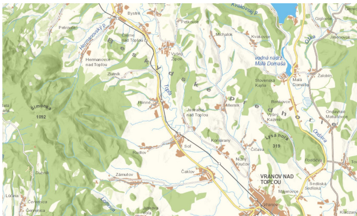
Obrázok č.1: Poloha obce Sol'

Poloha a dostupnosť Kataster obce sa rozprestiera v povodí Tople na severozápadnom výbežku Východoslovenskej nížiny, na rozhraní dvoch podcelkov Východoslovenskej pahorkatiny. Z juhozápadu tu zasahuje Podslanská pahorkatina a zo severovýchodu Toplianska niva. Podložie tvoria predovšetkým naplavené sedimentárne horniny (íly, ílovce, piesky, pieskovce, štrky, zlepenec a i.) z holocénu. Kataster obce susedí na severe s katastrami obcí Jastrabie nad Topľou a Hlinné, na západe Rudlov, na juhozápade Zámutov, na juhu Čaklov a na východe Komárany.